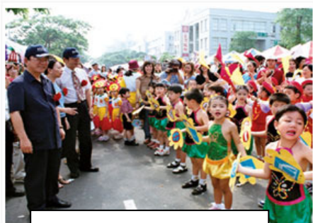
圖 5 縣長關懷教育

小朋友，你知道你現在為什麼可以每天吃得飽、穿得暖、住得舒適、行得方便、還有各式各樣的休閒設施可享用，讓你生活過得快樂而無憂無慮嗎？其實，這都是前人辛勤努力工作，眾人經營家鄉的成果啊！