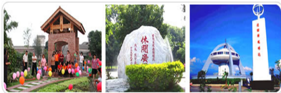
圖 2：水上鄉豐富的人文環境

阿里山的日出、雲海、森林、登山鐵路、晚霞這五種奇景世界聞名，阿里山除了有好山好水的山水色之外，最引人注目的莫過於一年一度的鄒族傳統祭典～瑪雅士比戰祭，這個祭典是由特富野及達邦兩個部落輪辦，每年舉辦時都吸引著全台各地的遊客，或國際人士前來觀賞、研究。