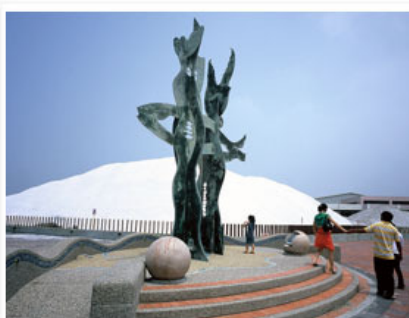
圖 8 提升觀光產業