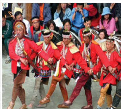
圖 7 發揚原住民文化