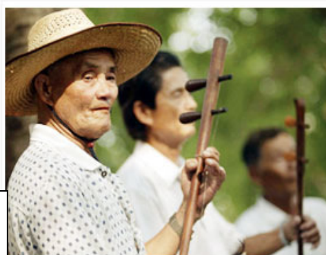
圖 6 重視老年人休閒活動