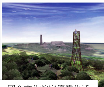
圖 9 文化故宮優質生活