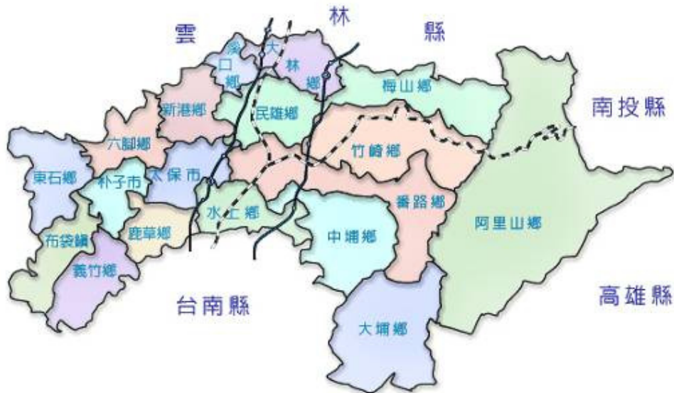
嘉義縣行政區域圖

新港鄉 位於 嘉義縣 的西北方，距離 嘉義市 約 16 公里，全鄉共 23 村，東邊接 民雄鄉 ，西連 六腳鄉 和 雲林縣 的 北港鎮 ，南為 太保市 和 六腳鄉 的 蒜頭 ，北與 溪口鄉 及 雲林縣 的 元長鄉 為界。