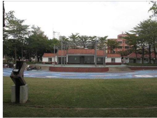
新港公園內景觀優美