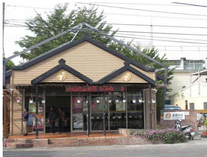
新港鐵路公園旁的遊客中心提供新港旅遊相關諮詢