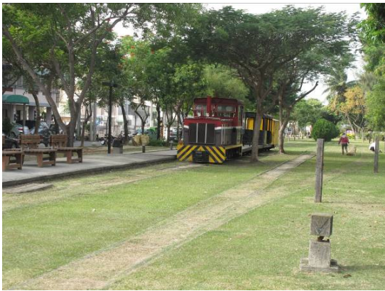
新港鐵路公園的綠地及老火車