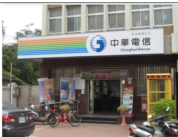
中華電信新港服務中心