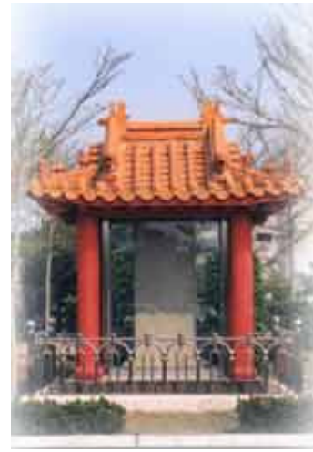
嘉義縣每年於文昌國小舉辦祭孔大典 新建登雲書院捐緣金名碑

登雲書院遺址 登雲書院是台灣過去在嘉義的四所書院中，唯一設在嘉義縣的，其他三所都在嘉義市內。除了登雲書院改建為文昌國小，以及其中的玉峰書院改建為祭祀保生大帝的震安宮之外，其餘兩所皆已毀壞殆盡。