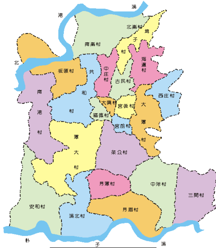
新港鄉行政區域圖