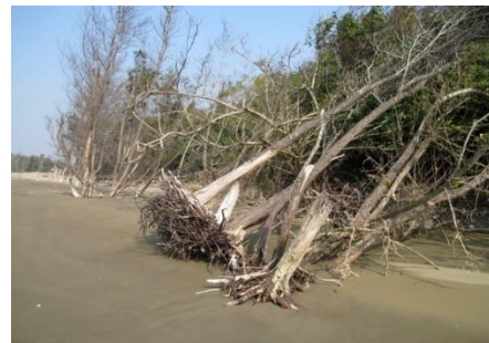
▲沙地的流失使防風林無立足之處