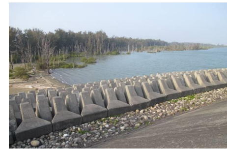
▲離岸沙洲與堤防包圍住整個天然潟湖

好美寮濕地的紅樹林主要分佈在龍宮溪口北方及好美寮潟湖的東西兩岸，以海茄苳最多，也可觀察到水筆仔、五梨跤及欖李。在潟湖西側亦有一片離岸沙洲，可看到耐鹽抗旱的植物分佈，如馬鞍藤、濱水菜等。動物生態相主要分佈於好美寮潟湖與離岸沙洲兩個區域，潟湖地區為傳統的牡蠣養殖區與魚塭，可見到許多養殖牡蠣的蚵架，潟湖北邊的泥灘地則有豐富貝類與蟹類資源，此處常見的貝類有文蛤、赤嘴蛤、孔雀蛤等。蟹類以和尚蟹、清白招潮蟹、弧邊招潮蟹最為常見。鳥類方面，在秋季與春季可以觀察到大量鵝科鳥類過境，如青足鵝、黃足鵝、翻石鵝，以及鐵嘴鵝、東方環頸雉等。