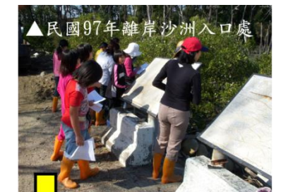
▲民國97年離岸沙洲入口處