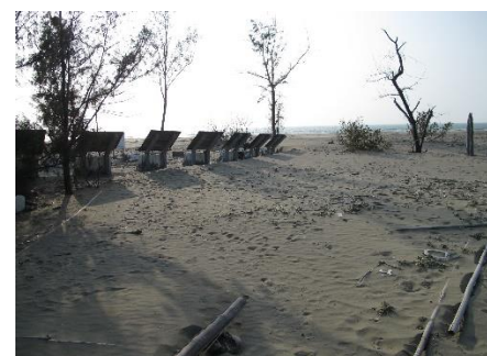
▲原本濃密的木麻黃防風林快速沙漠化