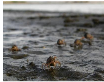
▲和尚蟹成群在沙灘地覓食