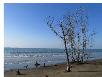
▲逐漸消失的離岸沙洲西岸