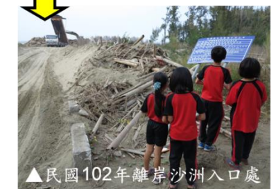
▲民國102年離岸沙洲入口處