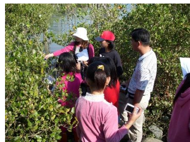
▲豐富生態吸引附近學校前往戶外教學

好美寮溼地的故事 好美寮濕地主要是潟湖的地形，四周都被開闢成魚塭，附近融合了沙洲、沙灘、鹽田、防風林、紅樹林等不同的棲地環境，多樣化自然生態背後亦包含了豐富的人文歷史。好美寮濕地範圍大致位於八掌溪口以北、布袋海埔新生地以南的區域，且早期由於西南沿岸積沙作用的影響，讓沙洲呈現各種不同的形態，遠觀有如猛虎俯臥，故又稱「虎尾寮」。在人文歷史方面，布袋港過去是先民開墾、移民的重要據點，與大陸通商往來十分熱絡，故曾有「小上海」的美稱。