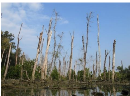
▲逐漸消失的木麻黃防風林

好美寮溼地的危機 好美寮潟湖周圍地帶為好美寮自然保護區中生態最為完整的區域，而在潟湖左側的離岸沙洲上，曾有大片木麻黃防風林，有為數眾多的鷺科鳥類在此築巢繁殖，但後來因為星天牛蟲害及地貌改變，使得木麻黃防風林枯毀傾倒，大群鷺科鳥類群聚的景象也不復見。台鹽曾於民國 76 年在此開發機械鹽灘，將紅樹林大量砍除，而龍宮溪出海口北方的抽沙工程及布袋商港凸堤效應也造成濕地快速的流失，再加上慕名而來的大量遊客所造成的垃圾問題，使得好美寮濕地難逃人為破壞的厄運。因此，如何維護這片珍貴的自然濕地已成為當務之急！