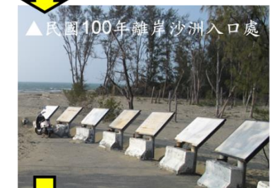
▲民國100年離岸沙洲入口處