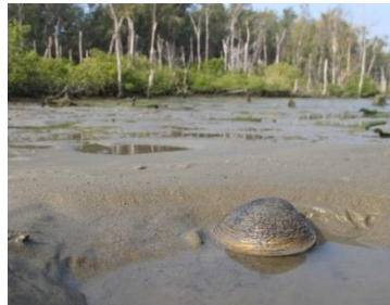
▲現已十分少見的馬蹄蛤（紅樹蜆）