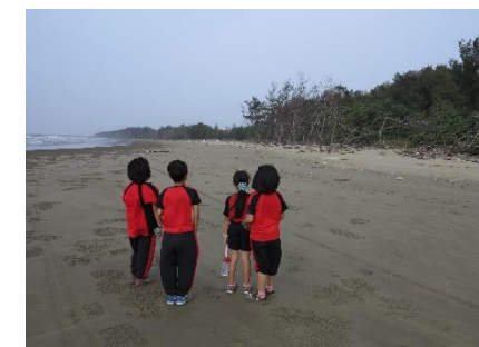
▲希望這片珍貴的濕地不要消失