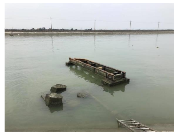
鹽業鐵橋遭拆除後留下的橋墩遺跡

可惜在台灣加入 WTO 之後，不敵外國低廉的鹽價優勢，隨即全台全面停止曬鹽，布袋也在民國九十年停止曬鹽，兩百多年歷史的布袋鹽業就此結束，而昔日極具特色的鹽業鐵道也步上被拆除的命運。目前僅存的部分鹽業鐵橋，雖有地方人士奔走呼籲保存，還是難逃拆除的命運，僅留下極少數的遺跡供鹽鐵迷追悼往日風光。