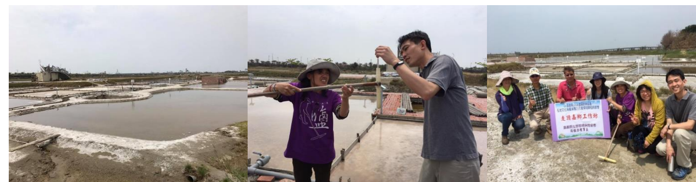
洲南鹽場的現有鹽田

下次有機會到布袋一遊，頂著酷夏的烈日，吹著熱熱的海風，視野所及的是魚塢、潟湖的汪洋，空氣中飄來的是海的氣味，腦中不仿想像著前輩先人的筆路藍縷，他們用汗水踏過的鹽田、鹽路，是布袋永遠的歷史印記，永遠在後人的心裡。