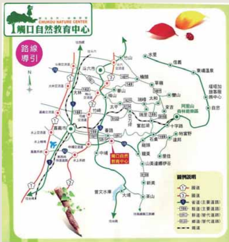
- 觸口自然教育中心交通路線圖 -